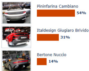
Foto in alta risoluzione della Cambiano sono disponibili per il download nella Area Press del sito Pininfarina:

Nuccio, Cambiano, Brivido: qual è la più bella?